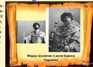
Фёдор Шалапин в роли Бориса Годунова

Академик и один из лучших историков Российской империи Василий Осипович Ключевский прослыл не только великолепным преподавателем и учёным. Многие отмечали его блестящее чувство юмора, феноменальную память и прекрасное знание самой истории. Например, однажды Фёдор Шалапин готовился к роли царя в постановке «Борис Годунов». Актёр решил побольше узнать о той эпохе и исторических персонах. За консультацией он как раз и обратился к Ключевскому. По воспоминаниям певца, академик не только привёл разговоры между Шуйским и Годуновым, но и старался передать характерно ярко, что я видел людей, изображаемых им. Когда я слышал из его уст Шуйского, мне думалось: «Как жаль, что Василий Осипович не поёт и не может сыграть со мною князя Василия», — писал Шалапин.